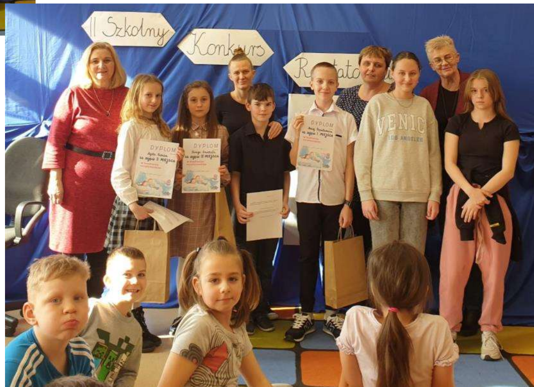
Konkurs przygotowali: K. Cynarska, M. Serafin, D.Chyclak. Oprac. DCh.